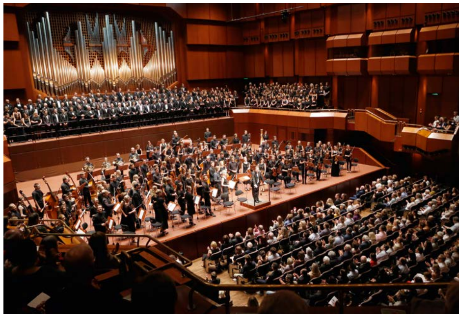
Der Chor des Collegium Musicum steht allen Studierenden, Mitarbeitenden und Ehemaligen der Universität offen.