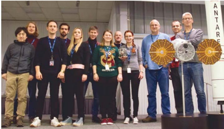
Vor dem Start: Das EXCISS-Team in Virginia (USA) mit einem Modell seines Experiments.

Studentisches »Überflieger«-Experiment auf der Raumstation ISS