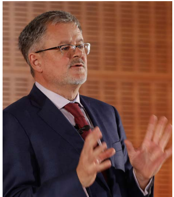
Nachdenklich und pointenreich: der Vortrag von Sir Christopher Clark, Professor für Neuere Europäische Geschichte an der Cambridge University, beim Festakt am 18. Oktober.