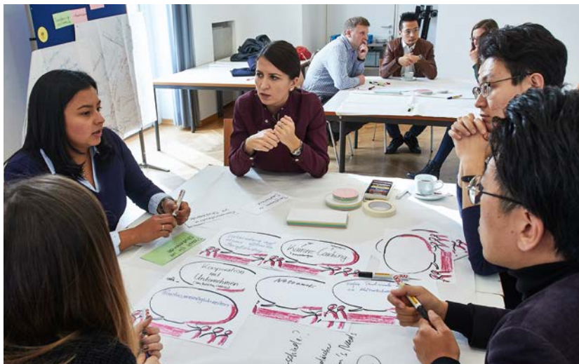
Das Internationale Studierenden-Alumni-Netzwerk wird aus Mitteln des Europäischen Sozialfonds und aus Mitteln des Landes Hessen gefördert.

Internationale Alumni unterstützen internationale Studierende in Frankfurt