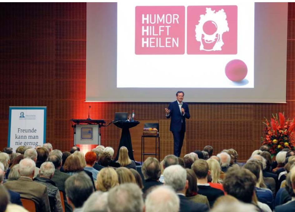
Amüsant und geistreich: Der Mediziner, Fernsehmoderator und Autor Dr. Eckart von Hirschhausen bei der Auftaktveranstaltung im November 2017.

Rückblick auf das Jubiläumsjahr der Freundesvereinigung