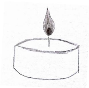
Abb. 1: einzelne brennende Kerze